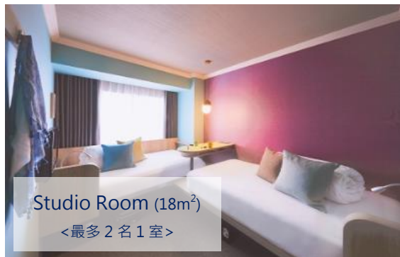
Studio Room (18m 2 ) <最多 2 名 1 室>

從旭川出發至北海道知名景點富良野、美瑛等都相當便利。當地更有旭山動物園、鹽味拉麵等道地美食美景，所到之處皆令人心神曠怡。OMO7 旭川將當地魅力集大成，連結旅客與城鎮間的城市觀光飯店。