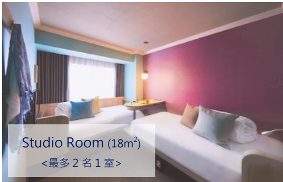
Studio Room (18m 2 ) <最多 2 名 1 室>

從旭川出發至北海道知名景點富良野、美瑛等都相當便利。當地更有旭山動物園、鹽味拉麵等道地美食美景，所到之處皆令人心神曠怡。OMO7 旭川將當地魅力集大成，連結旅客與城鎮間的城市觀光飯店。